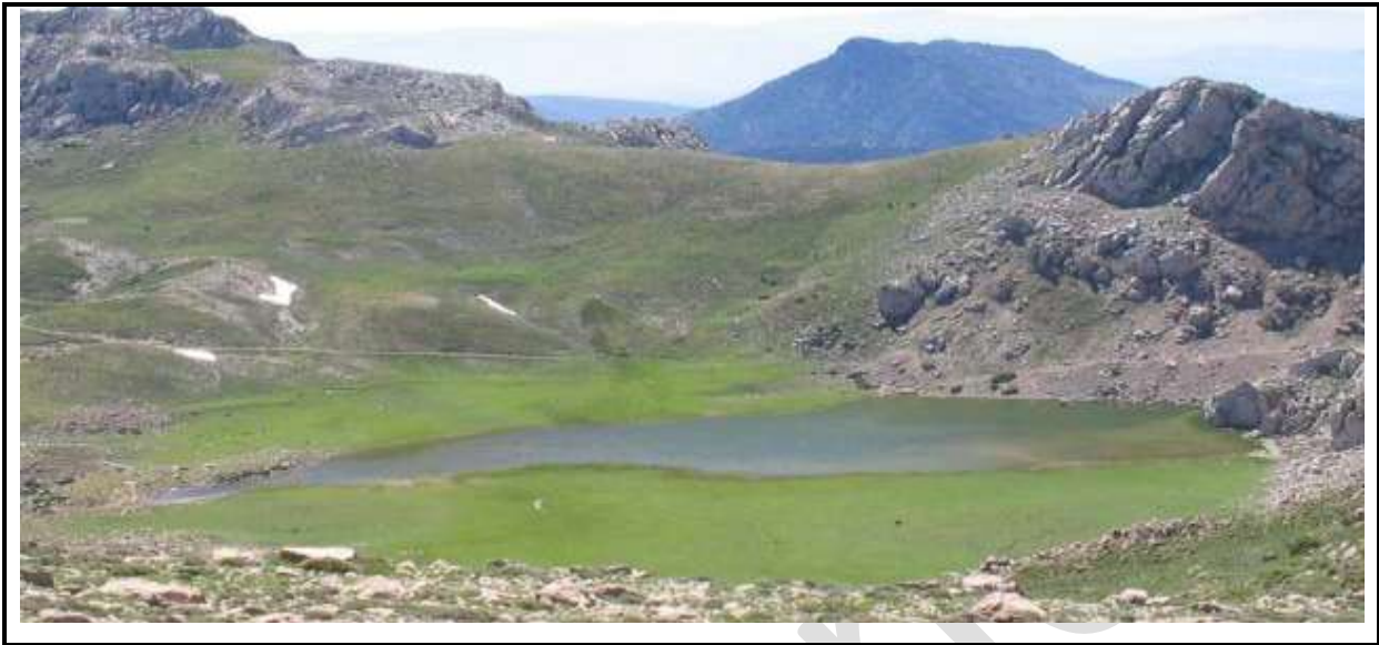
Figure 5 : Le Lac Aguelmim.

Le massif du Djurdjura, de par ses richesses floristiques, faunistiques et paysagères, attire un nombre considérable de touristes. Les lieux les plus fréquentés sont essentiellement Tikedjda et Tala-Guilef où se regroupe chaque week-end un nombre important de visiteurs (entre 12000 à 15000). L'alpinisme, la spéléologie, les randonnées, les campings sont les pratiques et moyens de découverte qui sont privilégiés et utilisés dans le parc.