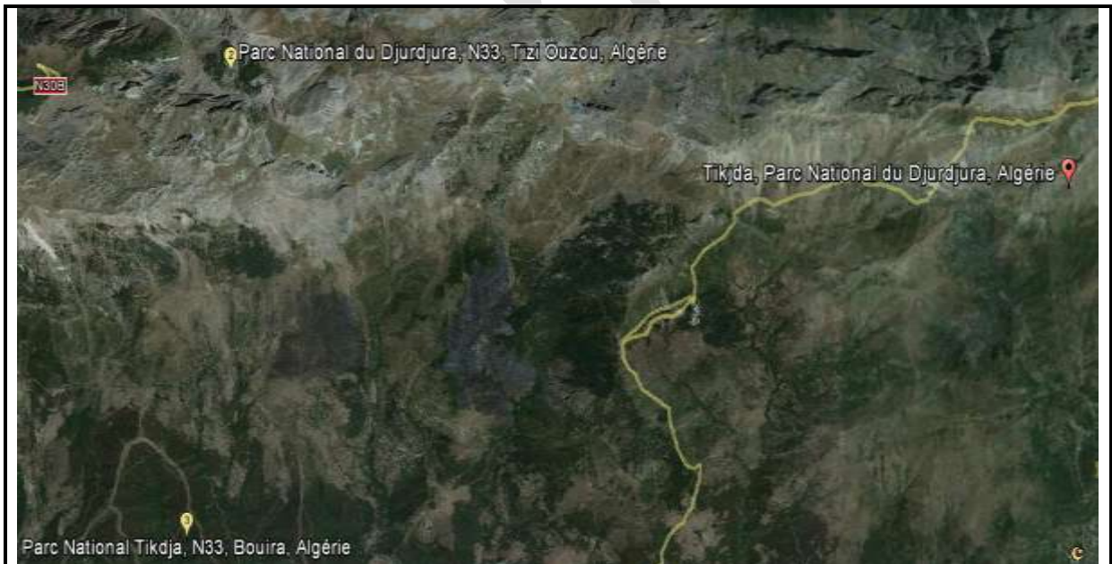
Figure 8 : Défiguration de l'espace (image par satellite le 13 /8/2011).

Après le dégât, nous avons vue une vaste dégradation sur le paysage naturelle (les montagnes couvert végétation vert).