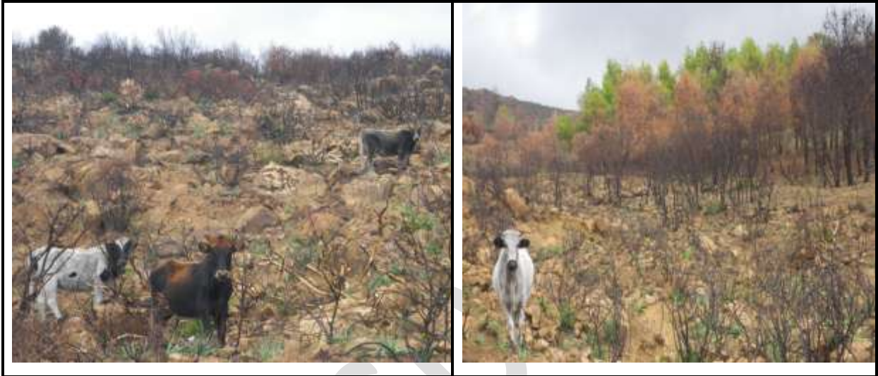
Figure 6 : Les vaches terrestres perdent leurs espaces de vivre à cause d'incendie.

En plus de ça les oiseaux, les rapaces, les passereaux et les mammifères sont perdue leurs espace de vive et leurs gite permanant.