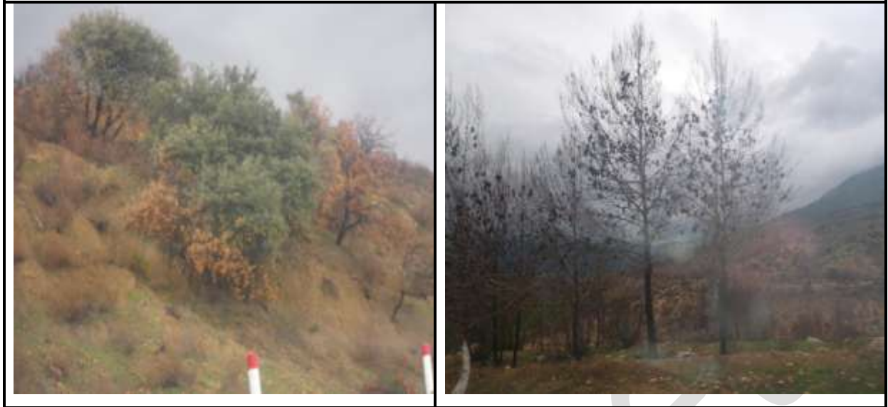
Figure 7 : Incendie de chêne vert (à gauche) et le pin d'Alep (à droite).