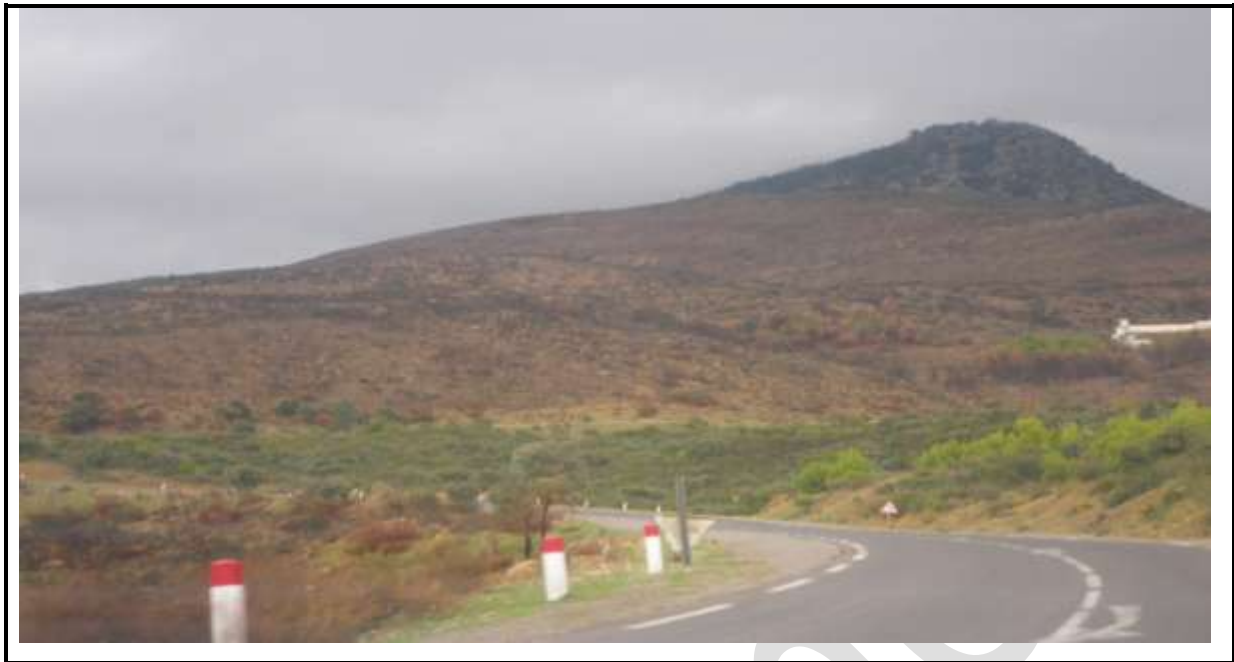
Figure 9 : Sommet de la montagne à été incendié complètement.