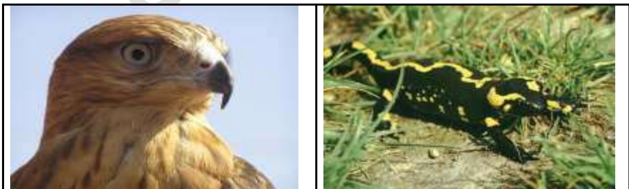
Figure 4 : La faune sur le parc (Aigle royal à gauche et Salamandre à droite).

Les mammifères sont très discrets aux yeux des visiteurs mais sont en réalité très actifs. Parmi les mammifères les plus caractéristiques de la région, nous citerons le singe magot qui vit en colonies avec près de 1200 à 1500 individus et seule espèce endémique à l'Afrique du Nord, la mangouste, le chacal, le serval (espèce probable) le lynx, la genette, le porc-épic, etc. La salamandre est un amphibien remarquable et vulnérable du parc national du Djurdjura.