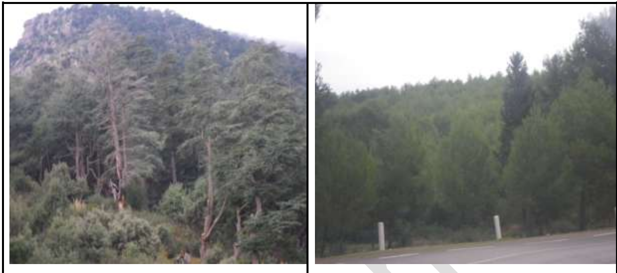
Figure 3 : La flore sur le parc (le cèdre à gauche et le pin d'Alep à droite).

marocaine, le pin noir, formant de petits îlots à Tigounatine et des sujets épars à Taouialt. Les sujets de pin d'Alep sont peu abondants, mais remontent à des altitudes élevées.