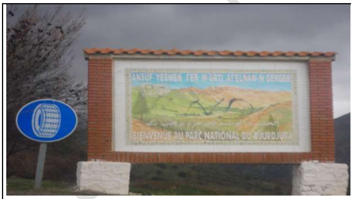
Figure 2 : Panneaux de bienvenue du parc.